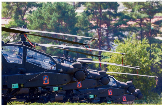
Helicópteros americanos Apache AH-64 usados em exercícios no campo de treinamento usado pelo exército dos EUA em Hohenfels, na Alemanha

Tom Fairless e Bertrand Benoit Dow Jones, de Görlitz (Alemanha)