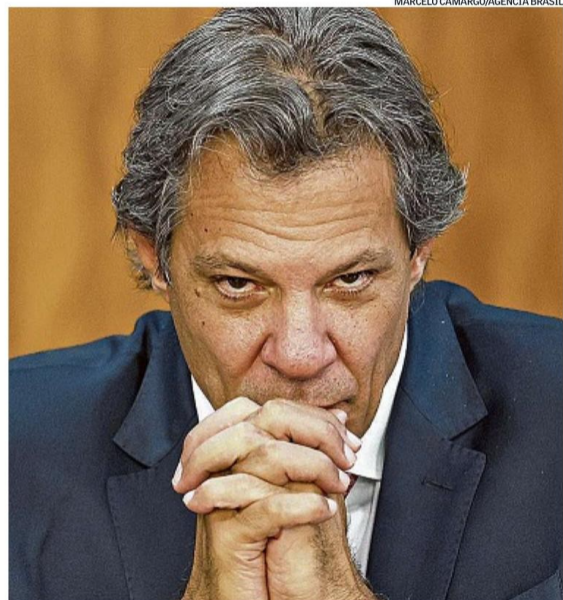
Fernando Haddad: Brasil está bem posicionado para economia de baixo carbono