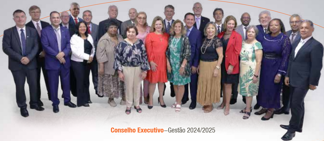
Conselho Executivo —Gestão 2024/2025