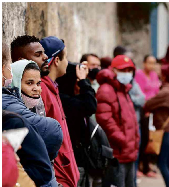
Beneficiários fazem fila para receber o Auxílio Brasil em São Paulo