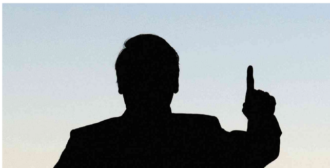
O presidente Jair Bolsonaro, durante solenidade, nesta terça (23), para a chegada do coração de d. Pedro 1º, em Brasília.

O governo Jair Bolsonaro (PL) deve propor, no envio da peça orçamentária de 2023, uma reserva para reajustes do funcionalismo do Poder Executivo menor do que o valor sinalizado inicialmente às categorias.