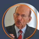
Jorge Hage ex-Ministro da CGU